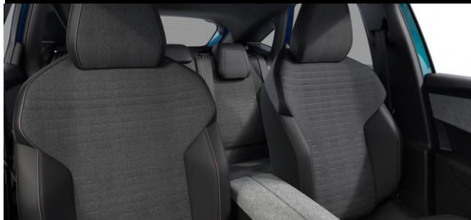
FALGO bőr-szövetkárpit 'kék' díszvarrással