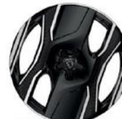
20"-os Yosemite felni Széria - Allure & GT (325 LE AWD BEV)