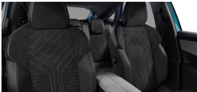
ICONIUM alcantara kárpit 'adamite zöld' díszvarrással