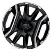
19"-os Fuji felni Széria - Allure & GT (PHEV és BEV)