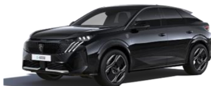
Perla Nera fekete