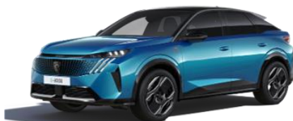
Obsession kék (Széria)