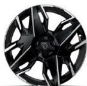
19"-os Yari felni Széria - Allure & GT (Hybrid)